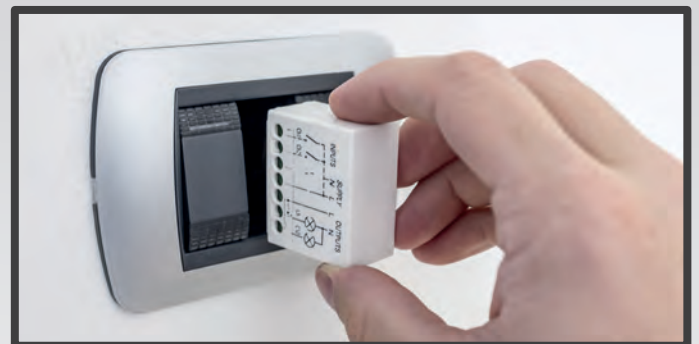
branchements pour la commande de deux lampes

Grâce à sa petite taille, il peut être installé à l'intérieur des plaques murales en commerce ou dans des petits espaces, est idéal pendant la rénovation ou l'amélioration de la maison, sans la nécessité de remplacer l'implant électrique ou d'effectuer de la maçonnerie coûteux.